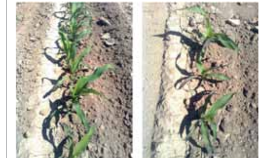
Фото 2. Ефективність засвоєння фосфору при внесенні добрив Квантум ДІАФАН.

Інші мікроелементи – залізо, мідь та марганець – також є потужними каталізаторами ферментативних процесів у проростках та відіграють важливі метаболічні функції. Зрозуміло, що низький їх вміст у насінні не може не відбитися на проростанні й польовій схожості рослин. Між культурами існують варіації між хімічним складом насіння та їх потребою в різних елементах живлення, тому НВК «Квадрат» створено збалансовані для різних груп культур комплексні добрива Квантум ЗЕРНОВІ та Квантум ТЕХНІЧНІ, які дають змогу забезпечити сходи необхідною кількістю всіх макро- та мікроелементів на початкових етапах розвитку.