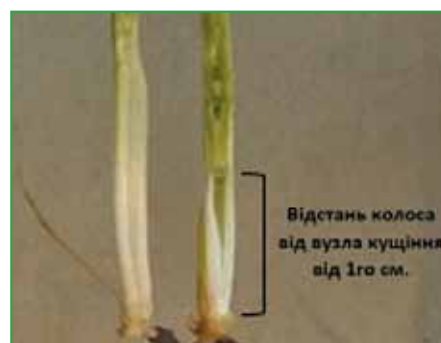
Рис. 1. Фаза початку виходу в трубку озимої пшениці (ВВСН 30)

Починаючи з фази середини куцання, в період закладання колоса (формування репродуктивних органів), запліднення та дозрівання