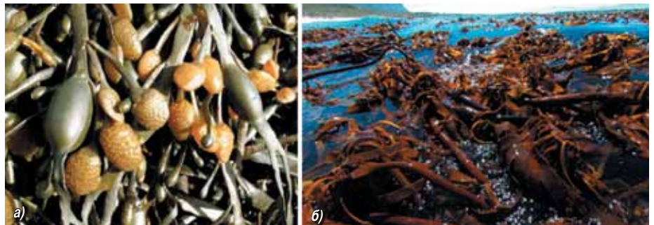
Рис. 1. Водорості Ascophyllum nodosum (а) та Ecklonia maxima (б).

Екстракти водоростей стають все більш популярним інструментом підвищення продуктивності як в традиційних технологіях вирощування сільськогосподарських культур, так і за вирощування органічної продукції. Ці продукти складають близько 40 % ринку біостимуляторів. Щорічно в якості біодобавок до кормів та біостимуляторів використовуються понад 15 млн т продуктів на основі морських водоростей.