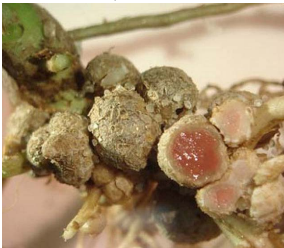
Рис. 1. Здорові бульбочкові бактерії, які ефективно фіксують азот

Близько 50-60% своєї потреби в азоті соя задовольняє шляхом біологічної фіксації азоту за допомогою симбіотичних мікроорганізмів. Перевірити оптимальність умов азотфіксації дозволяє колір корневих утворень, азот здатні фіксувати тільки бульбочки рожевого кольору, в яких локалізований червоний пігментний білок – леггемоглобін (рис.1).